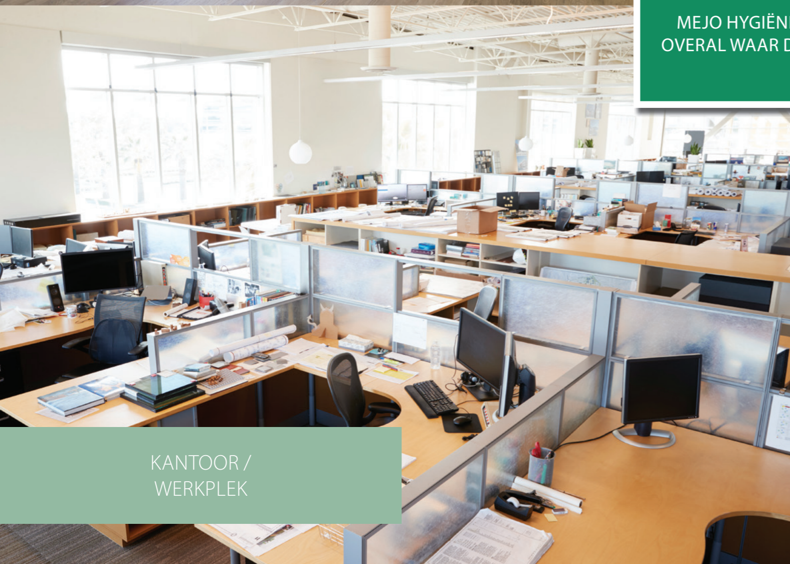
KANTOOR / WERKPLEK

MEJO HYGIËNEBESCHERMING. OVERAL WAAR DIT BELANGRIJK IS.