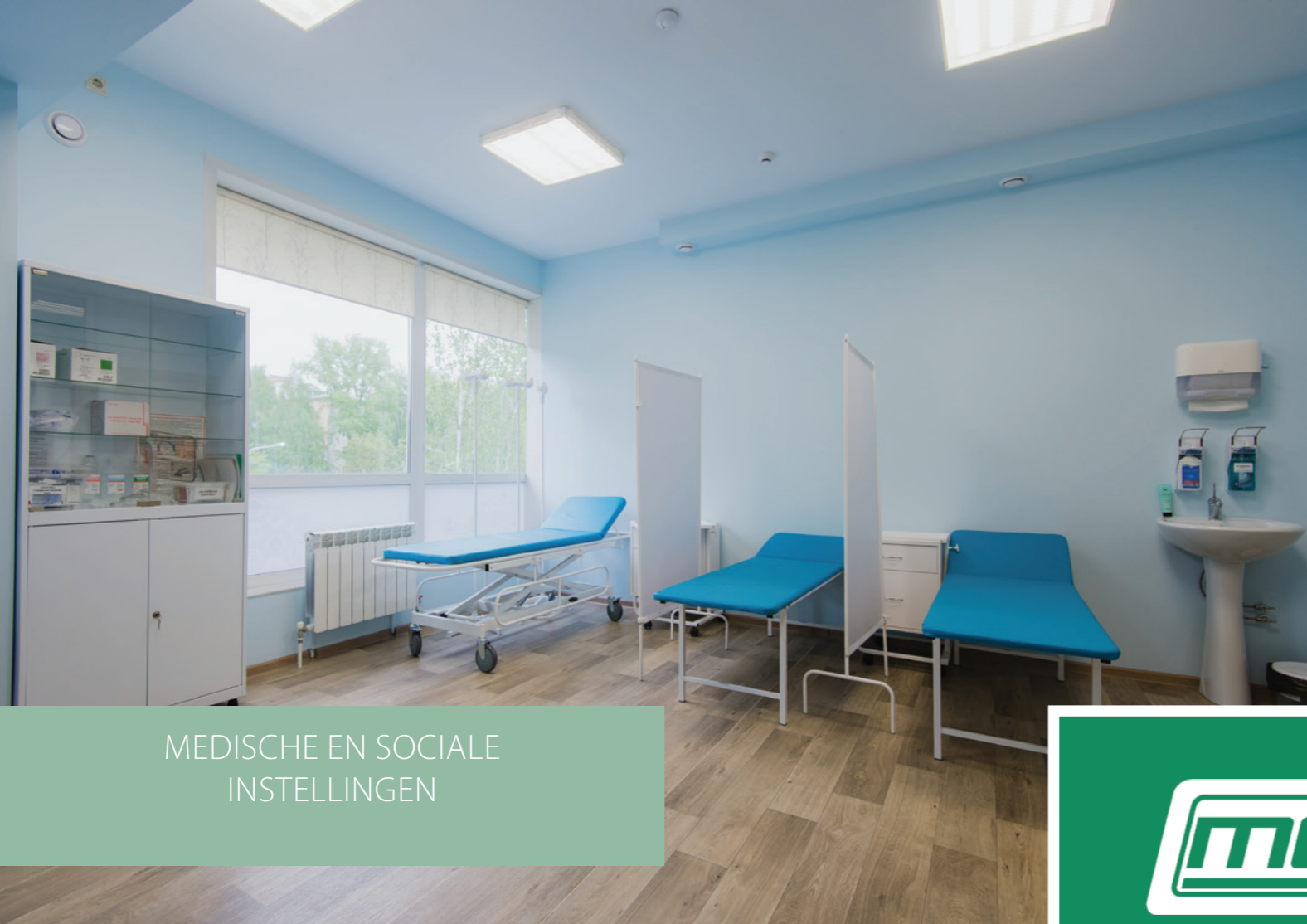
MEDISCHE EN SOCIALE INSTELLINGEN