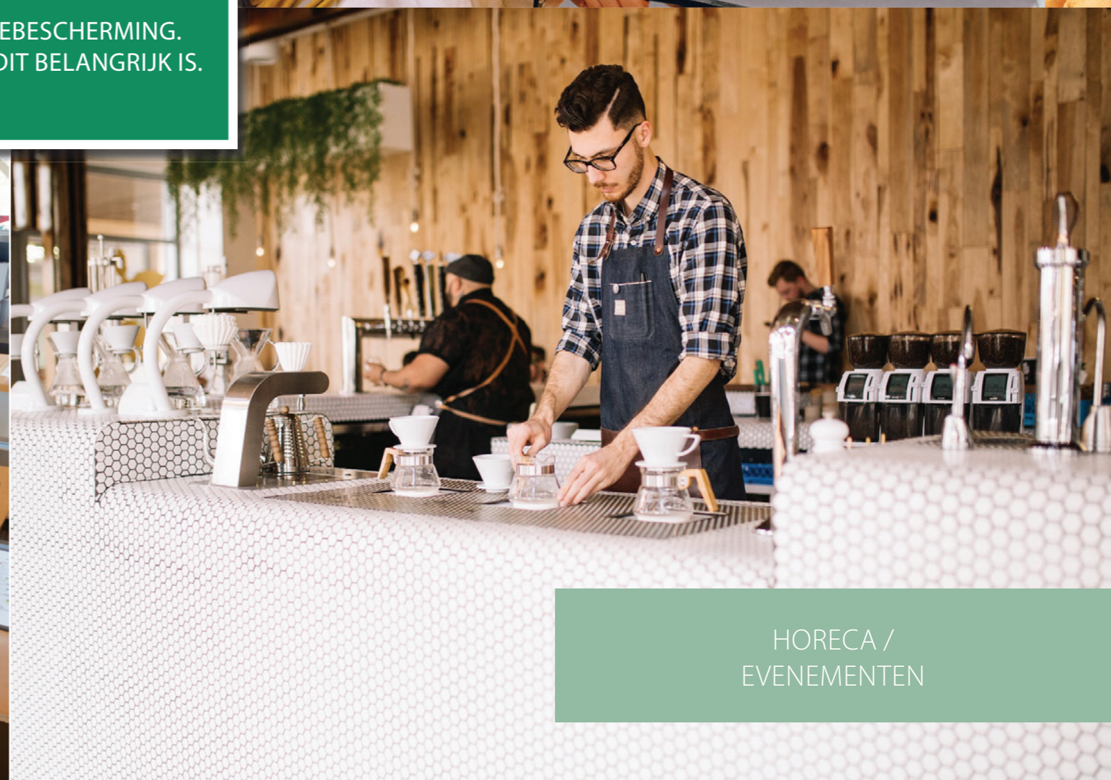
HORECA / EVENEMENTEN