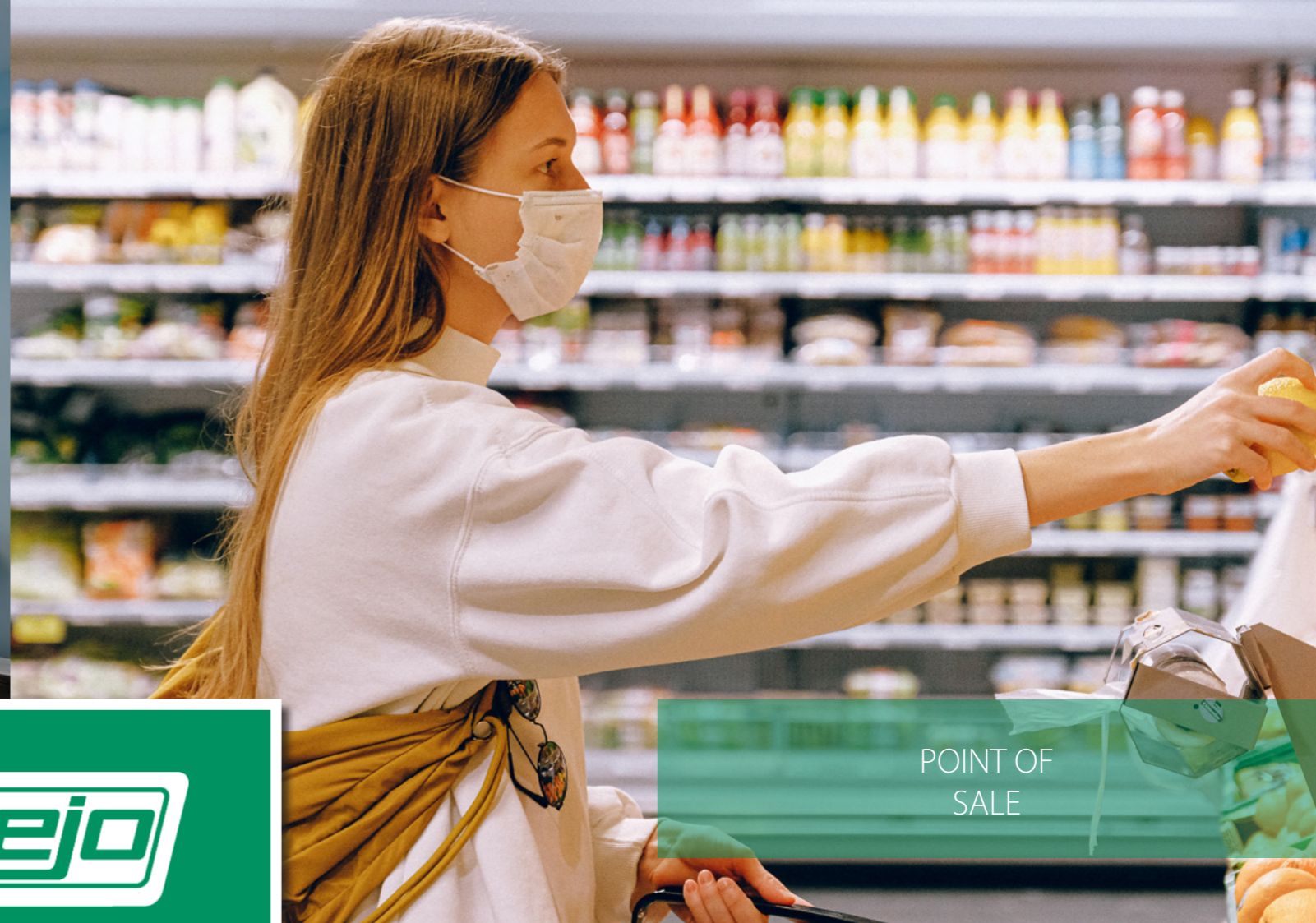
POINT OF SALE