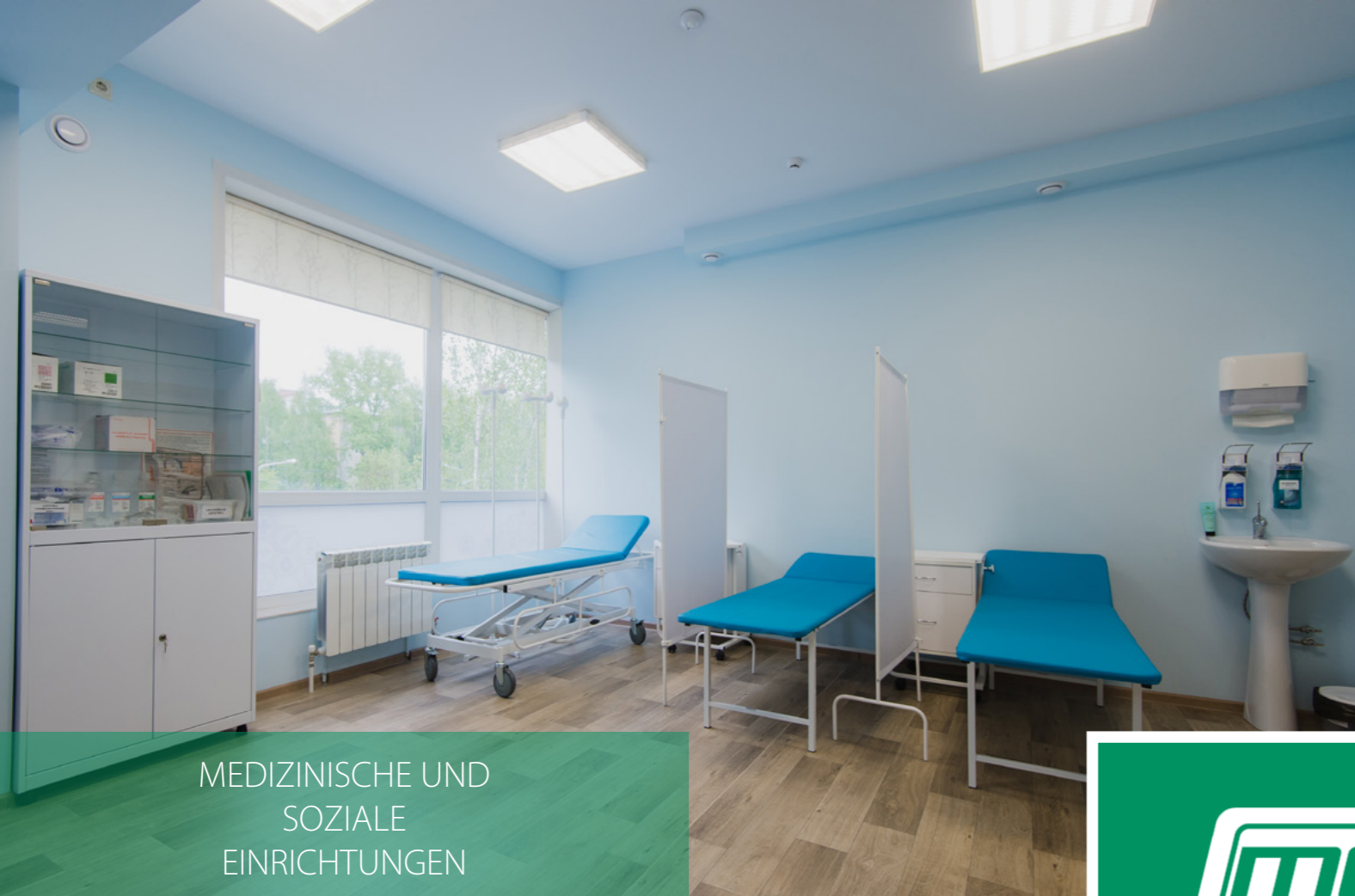
MEDIZINISCHE UND SOZIALE EINRICHTUNGEN