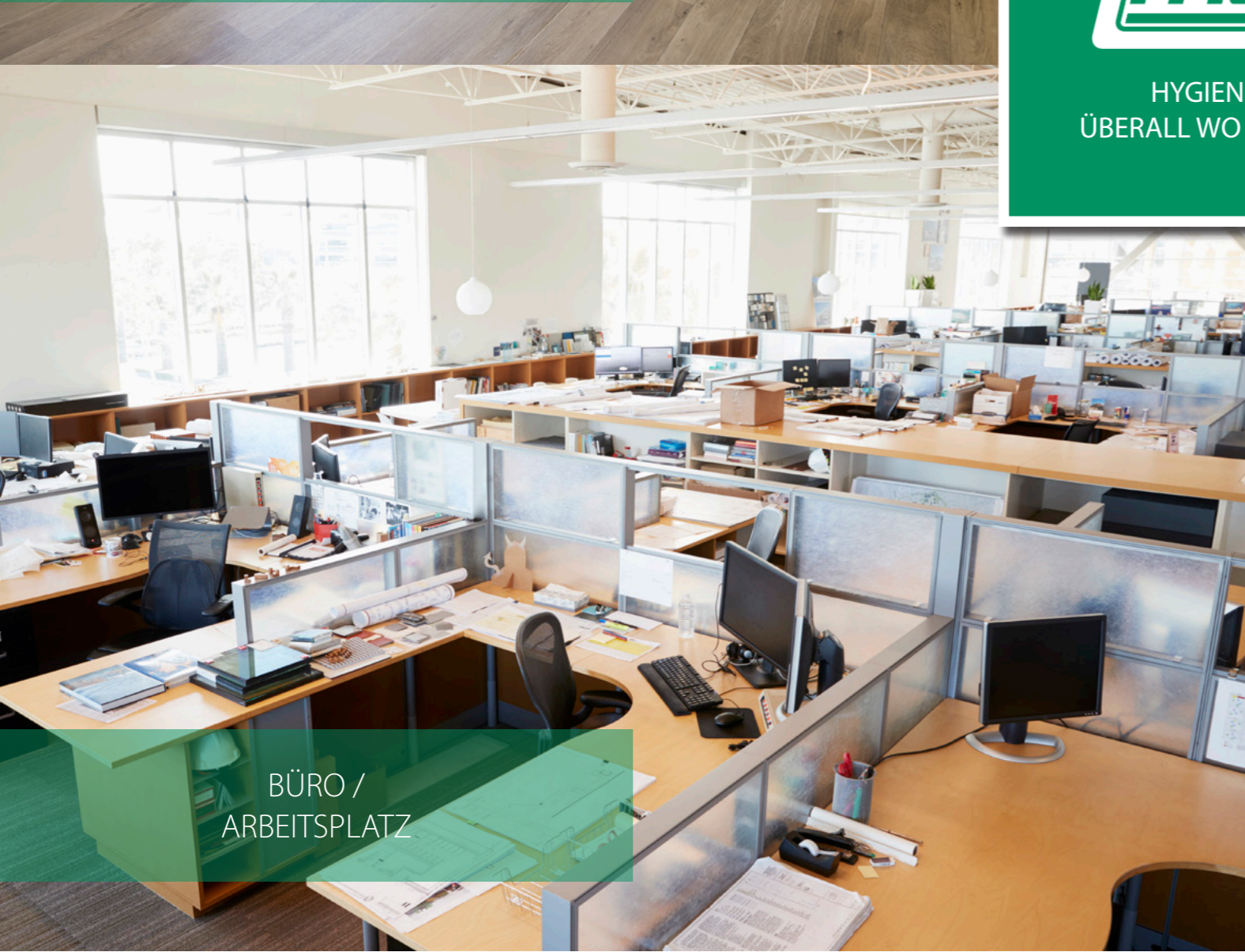
BÜRO / ARBEITSPLATZ

HYGIENESCHUTZ. ÜBERALL WO ES WICHTIG IST.