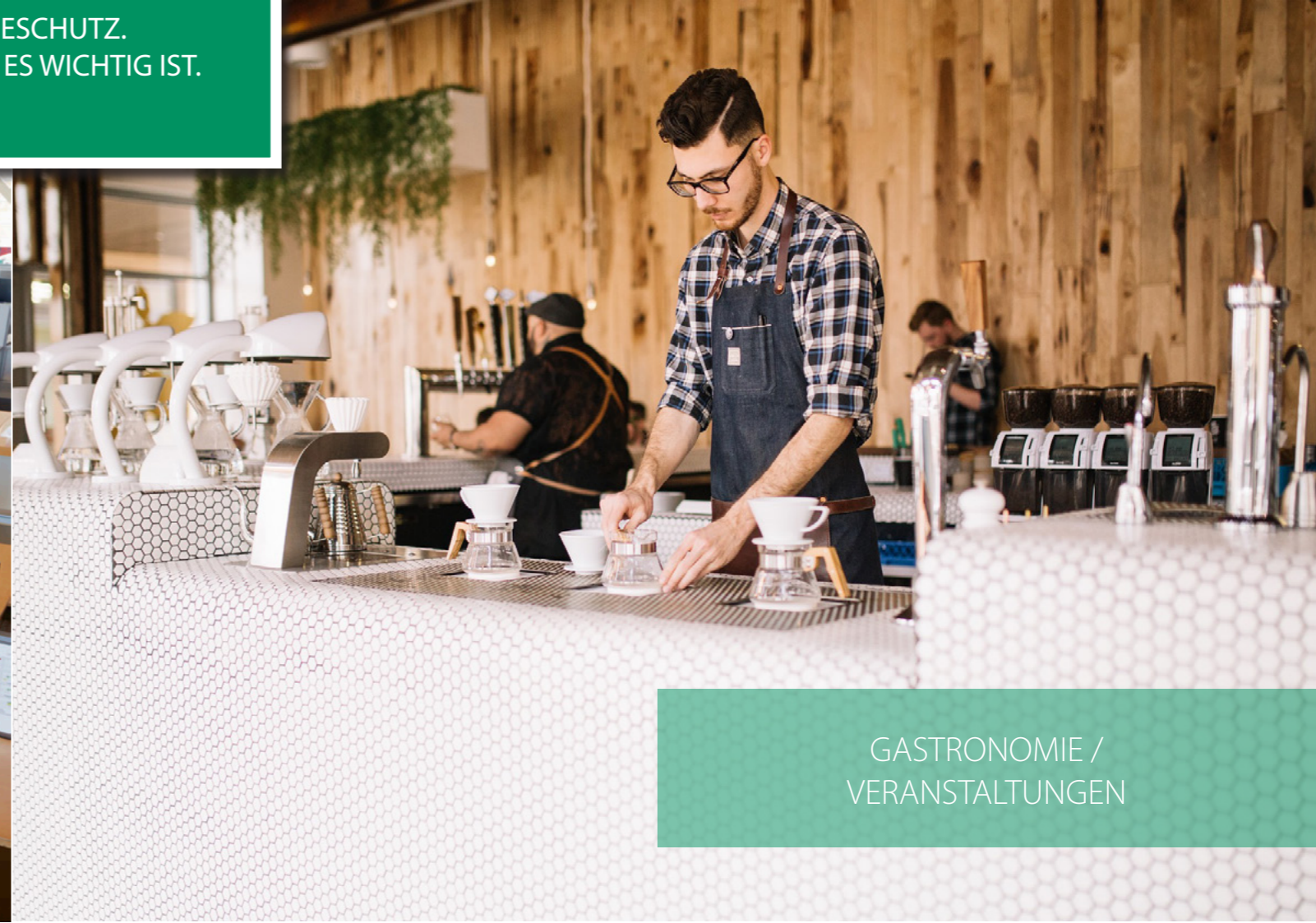
GASTRONOMIE / VERANSTALTUNGEN