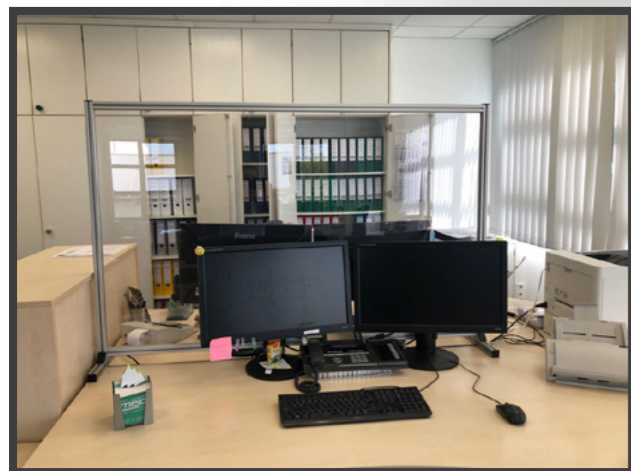
Hustenschutz für Bürotische