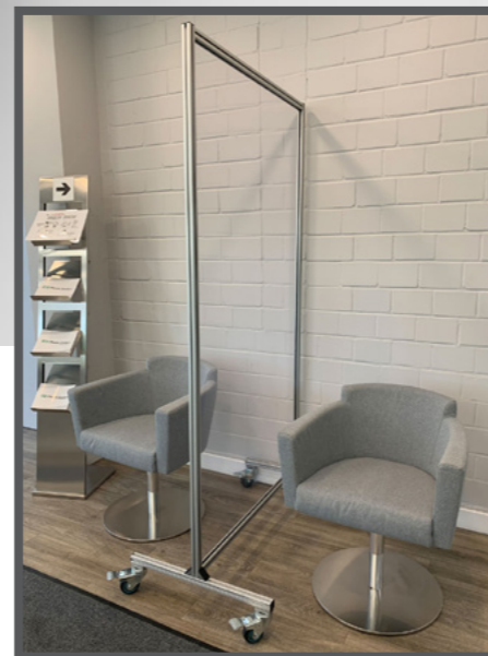
Trennwand am Bedienplatz